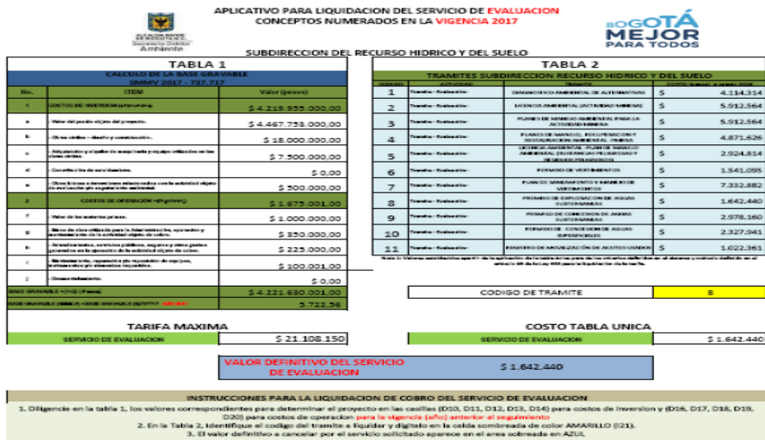
Figura 3. Liquidación por pago de evaluación